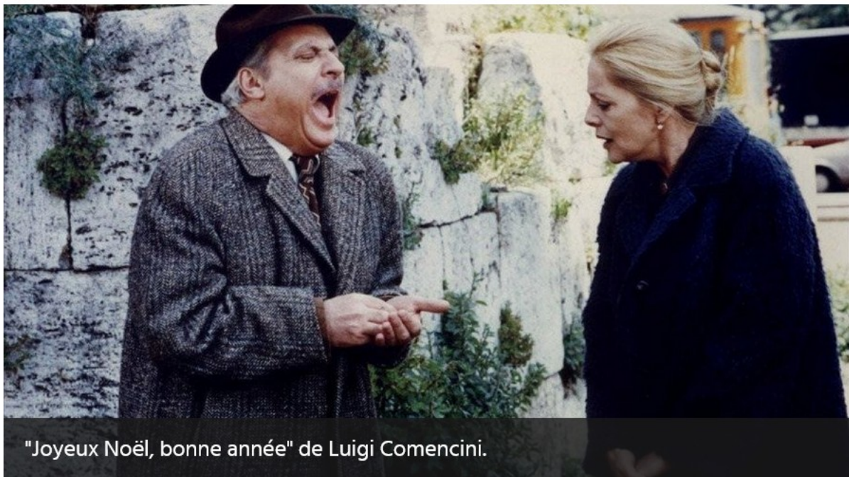
"Joyeux Noël, bonne année" de Luigi Comencini.